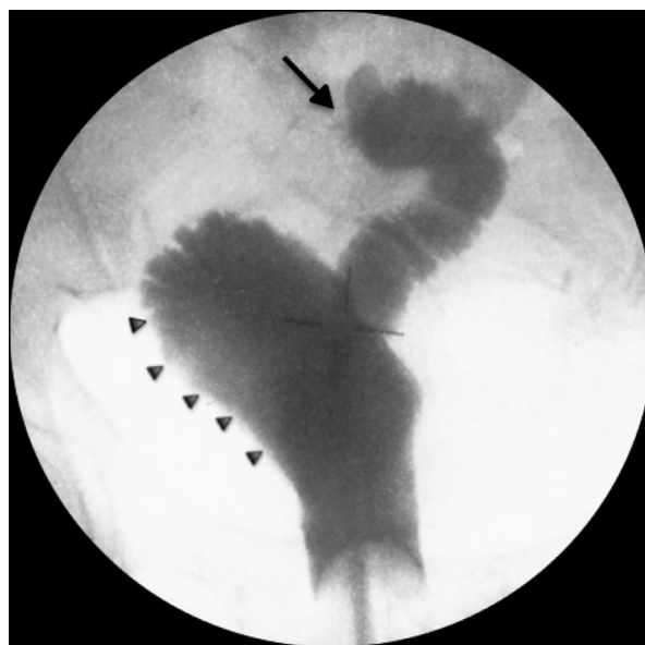
Figura 2 Pós-operatório: reservatório (setas pequenas) e ansa aferente (seta) após injeção retrógrada de contraste.

As modificações em relação à técnica original descrita por Studer 6 incluíram uma incisão maior na zona inferior da parede da neobexiga e o uso de 2 suturas contínuas para a