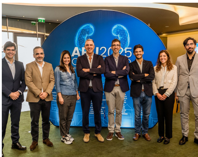
Novo Conselho Diretivo biênio 2025-2027