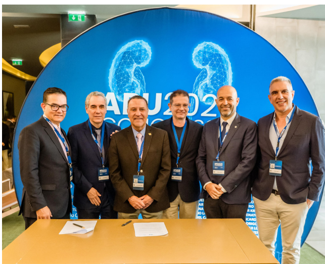
Assinatura do Memorando de Entendimento entre APU e a SBU

“A participação de uma grande e significativa comitiva de colegas de Espanha e da América do Sul, nomeadamente do Brasil”, foram a nota de relevância na opinião do clínico. A organização conjunta correu conforme o previsto, “numa excelente articulação dos dois Serviços de Urologia e com uma grande cumplicidade e complementaridade científica, enriquecendo muito a qualidade do Congresso” . “Penso que as organizações partilhadas são possíveis, mas têm de ser analisadas caso a caso, dependendo dos momentos e dos Serviços envolvidos”, conclui.