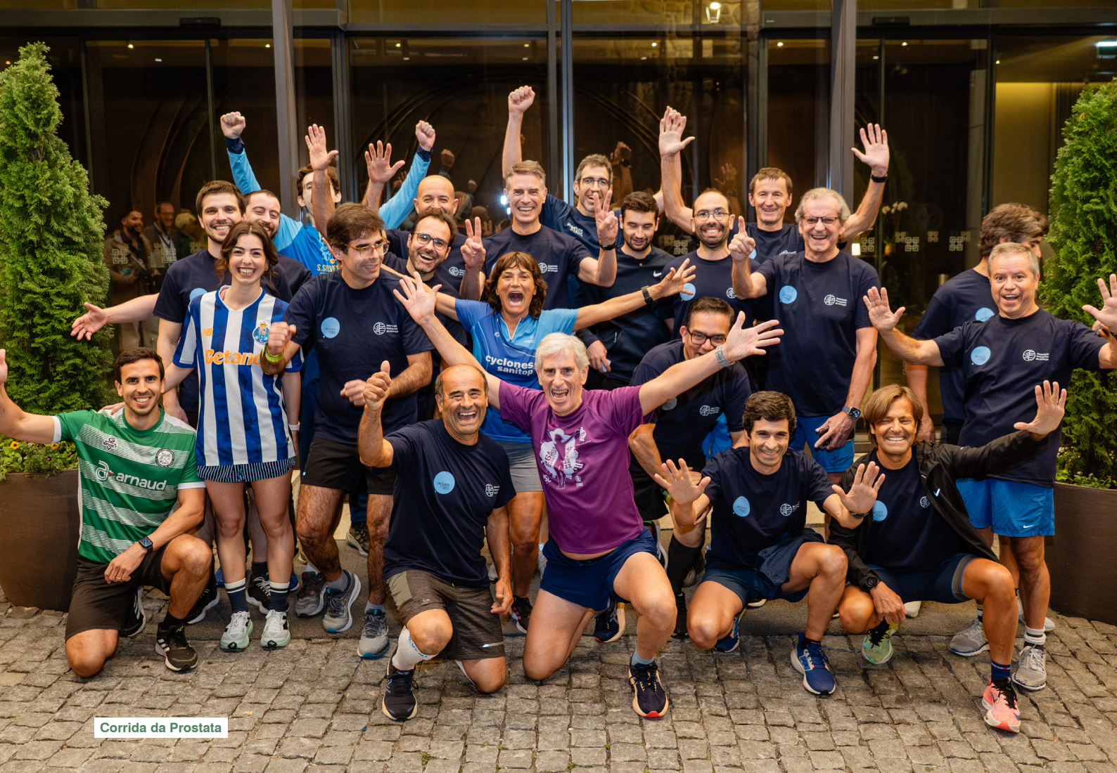
Corrida da Prostata