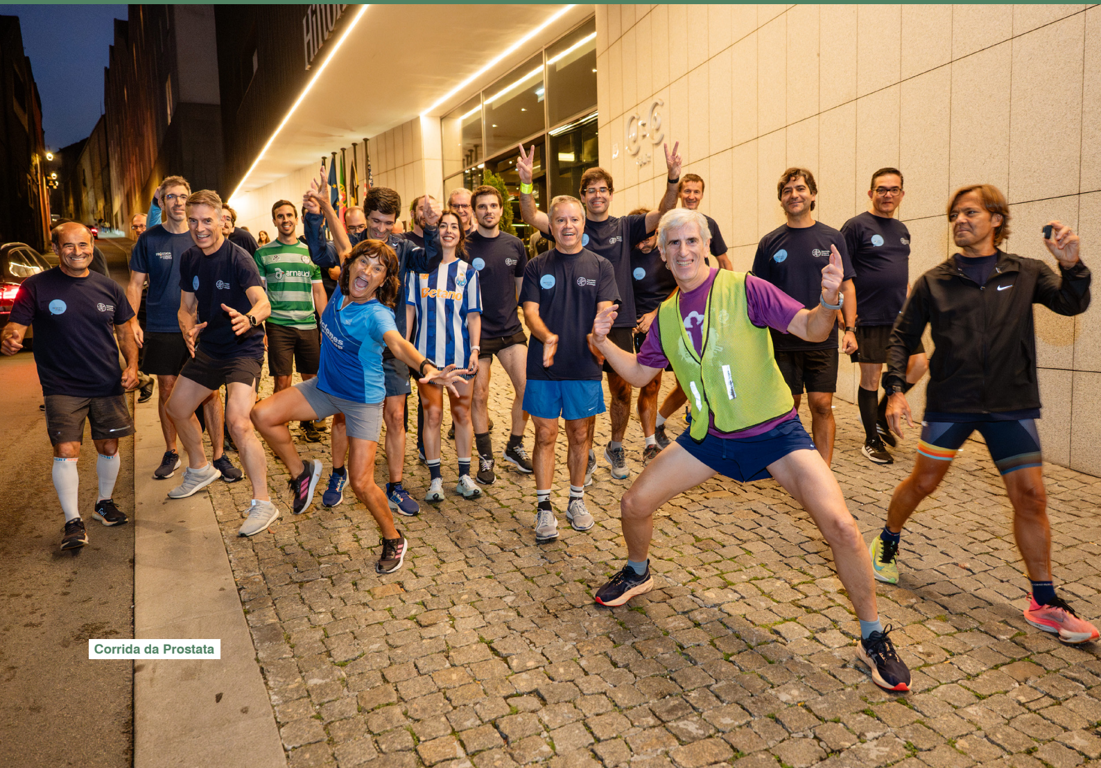
Corrida da Prostata