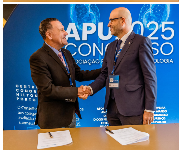
Assinatura do Memorando de Entendimento entre APU e a SBU