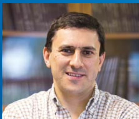
CENTRO PEDRO SIMÕES