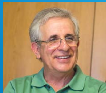
CENTRO SUL CARRASQUINHO GOMES